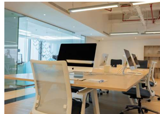
المختبر WORKING STATIONS