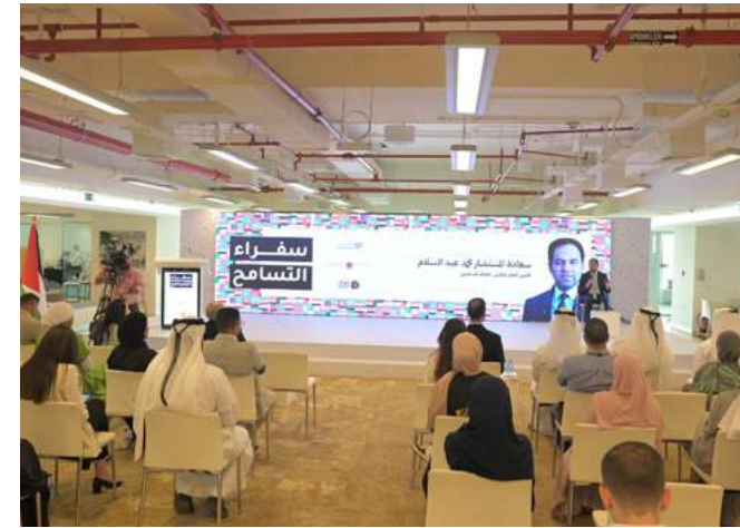
المسرح الرئيسي MAIN STAGE