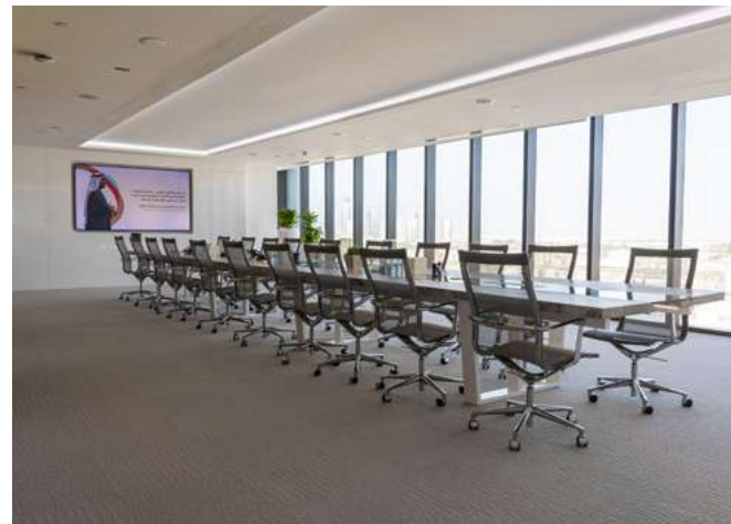
الديوان AL DIWAN