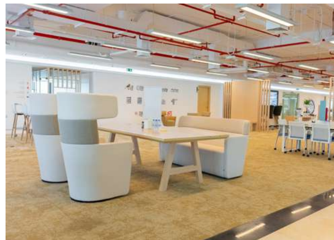
الديوان THE IWAN