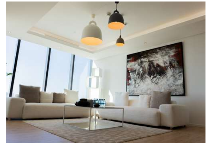
الصالون THE SALON