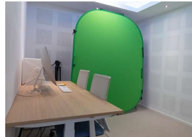
القمرة AL QOMRAH