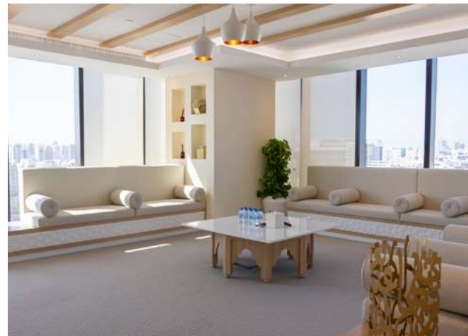
المجلس THE MAJLIS