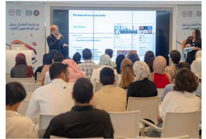
القاعة الرئيسية MAIN HALL